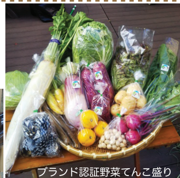
ブランド認証野菜てんこ盛り